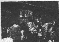
演目後のふれあいタイム。 ガムラン楽器に触れました。

ワヤン(インドネシアの影絵芝居)は、お話しのみにもあったように、本当は外の広い場所です。ねころんだりくつろいでいろいろな角度からみて楽しむのだそうです。今回観た「おしそなピモ」も、一晩中かけて楽しむのがいいお話しのごく一部だそうですよ。のんびりゆったりしたお雰囲気ですね。そんな雰囲気の中でも一度見てみたいとおもいました。(西遊来 ブロック長)